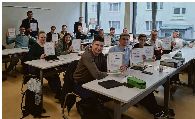
Die Stadtrodaer Fachschüler mit ihren Zertifikaten der Ofenakademie.

Der Kurs behandelt unter anderem die richtige Brennstoffwahl, das optimale Anzünden von Holzfeuerungen sowie typische Fehlerquellen beim Heizen. Die Schüler lernten