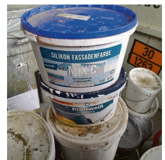
Wasserfarben (Beispielbild) können in der Restmülltonne entsorgt werden.