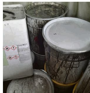
Lackfarben (Beispielbild) sollten am Schadstoffmobil abgegeben werden.

Wasserbasierte Farben können Sie, nachdem sie eingetrocknet sind, in der Restmülltonne entsorgen .