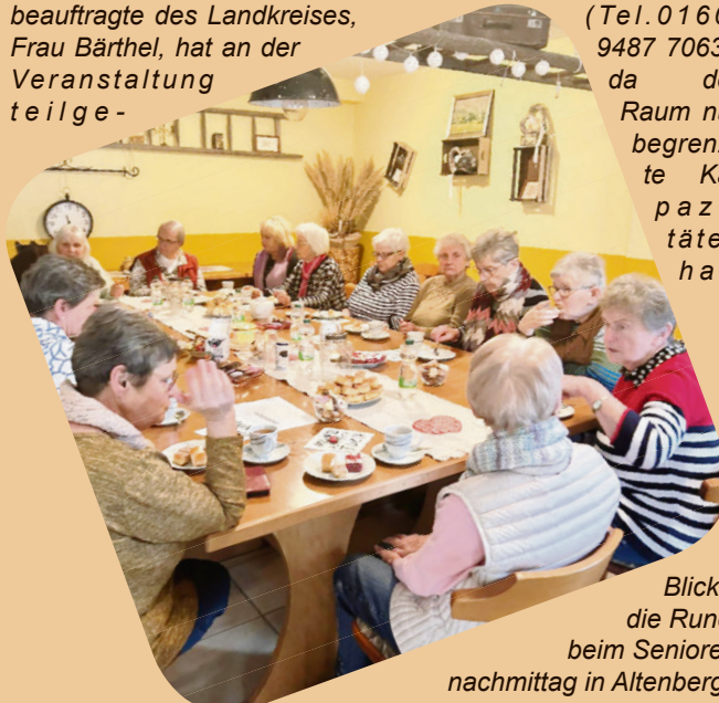
Blick in die Runde beim Seniorennachmittag in Altenberga.

Anmeldung (Tel. 0160/ 9487 7063), da der Raum nur begrenzte Kapazitäten hat.