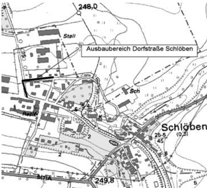
Hermsdorf, den 01.08.05

In die Planungsunterlagen und Satzungen kann nach telefonischer Anmeldung (Tel. 036601/ 578-0) in unseren Geschäftsräumen in Hermsdorf, Robert-Friese-Str. 2, Einsicht genommen werden.