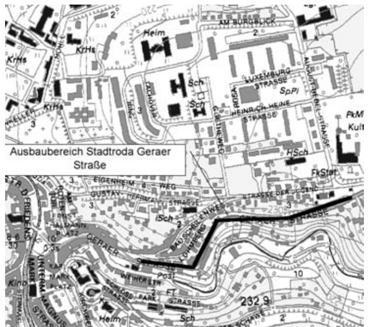
Hermsdorf, den 01.08.05

In die Planungsunterlagen und Satzungen kann nach telefonischer Anmeldung (Tel. 036601/ 578-0) in unseren Geschäftsräumen in Hermsdorf, Robert-Friese-Str. 2, Einsicht genommen werden.